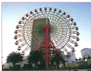
ハーバーランド観覧車